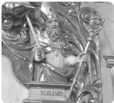
Pfarrkirche Niederolang